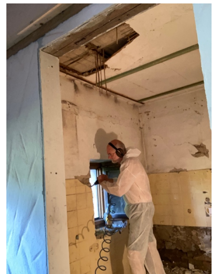
Wie alles begann...

Wenn Ihnen ein Missgeschick passiert und etwas zu Bruch geht oder etwas defekt ist - kein Problem. Aber teilen Sie uns dies bitte mit, damit wir es schnellstmöglich wieder in Ordnung bringen können und die nächsten Gäste eine komplett ausgestattete Wohnung vorfinden.